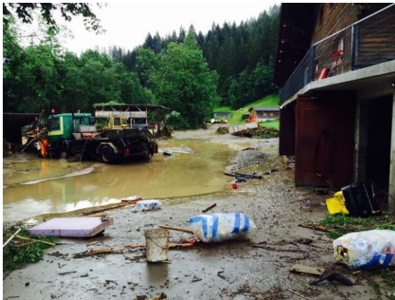
Teile des Emmeufers wurden überflutet und Wasser floss in Keller. Die Rega musste vereinzelt Personen von ihren Höfen evakuieren.