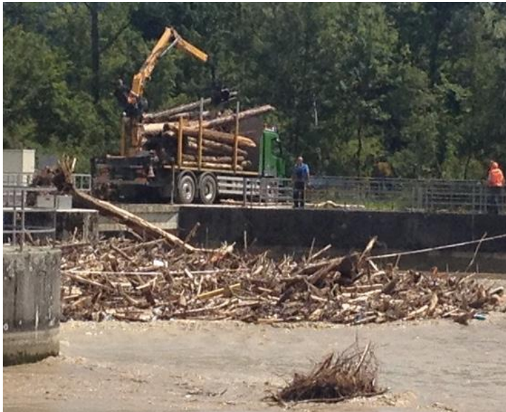
Beim Aare-Laufkraftwerk Flumenthal (SO) wurde so viel Schwemmholz wie möglich aus dem Wasser geholt, damit die Aare ungehindert abfließen kann.