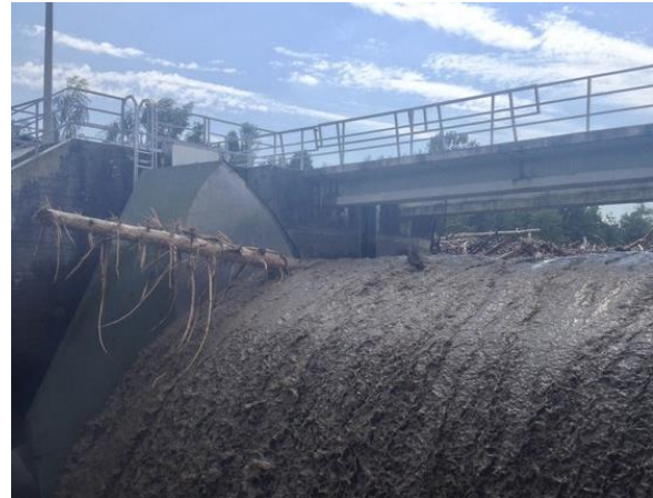
Ganze Baumstämme bleiben im Wehr des Laufkraftwerk Flumenthal hängen.